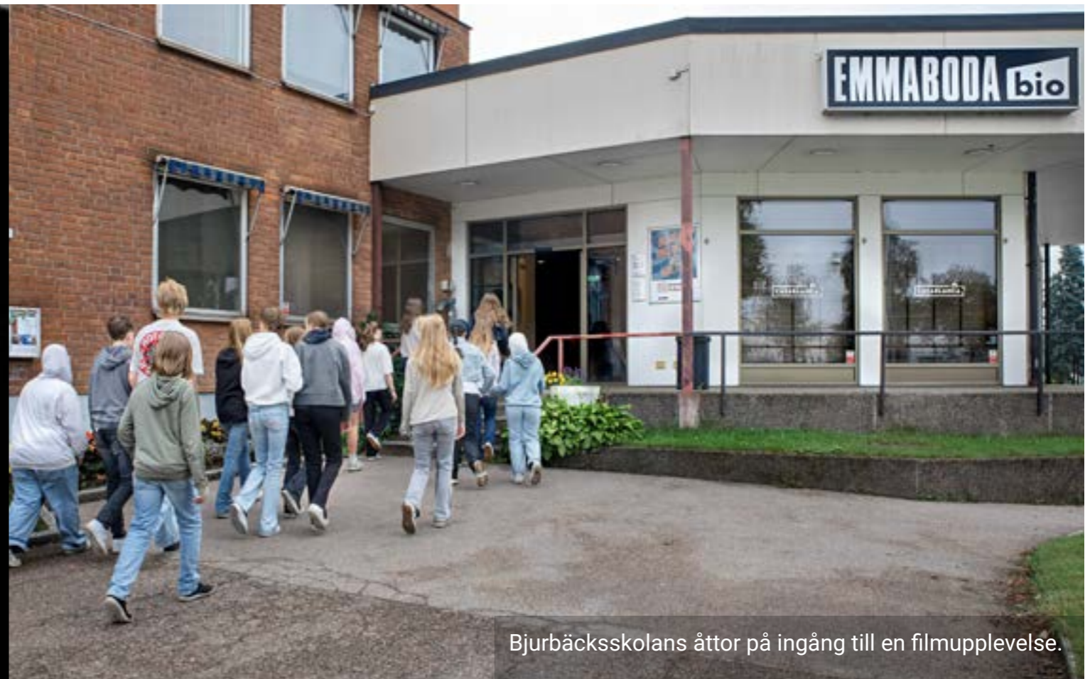
Bjurbäcksskolans åttor på ingång till en filmupplevelse.