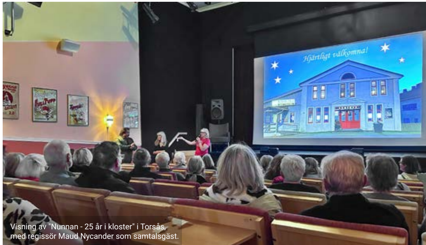
Visning av "Nunnan - 25 år i kloster" i Torsås, med regissör Maud Nycander som samtalsgäst.