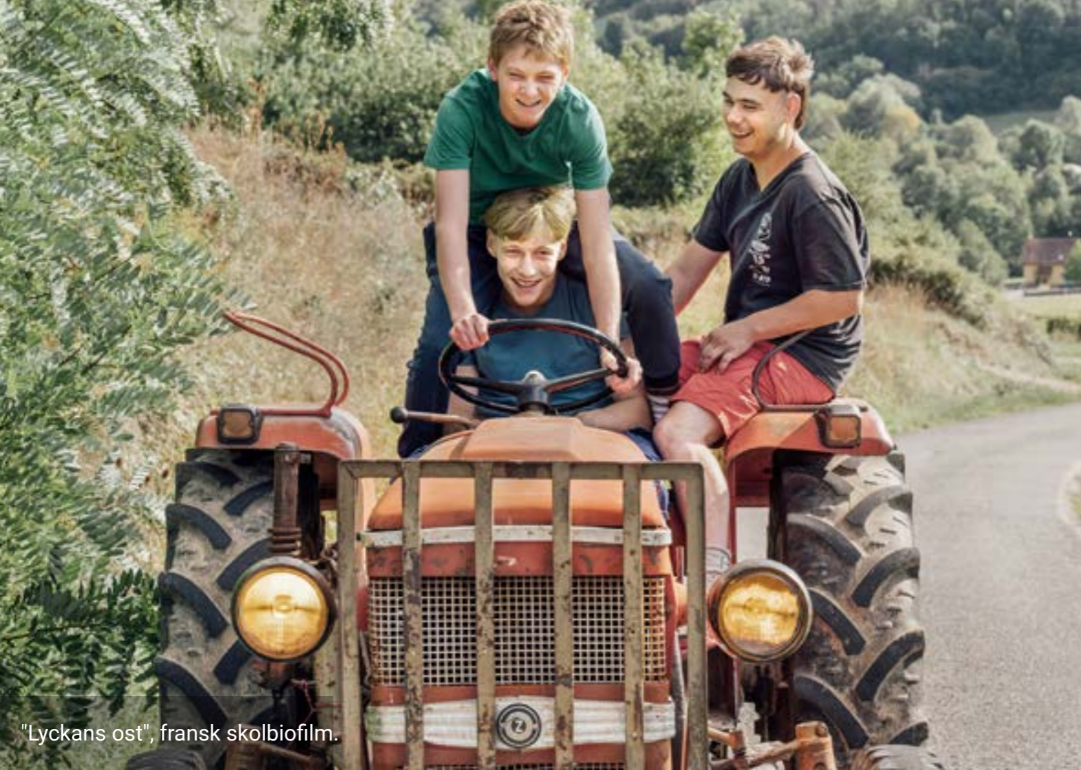
"Lyckans ost", fransk skolbiofilm.