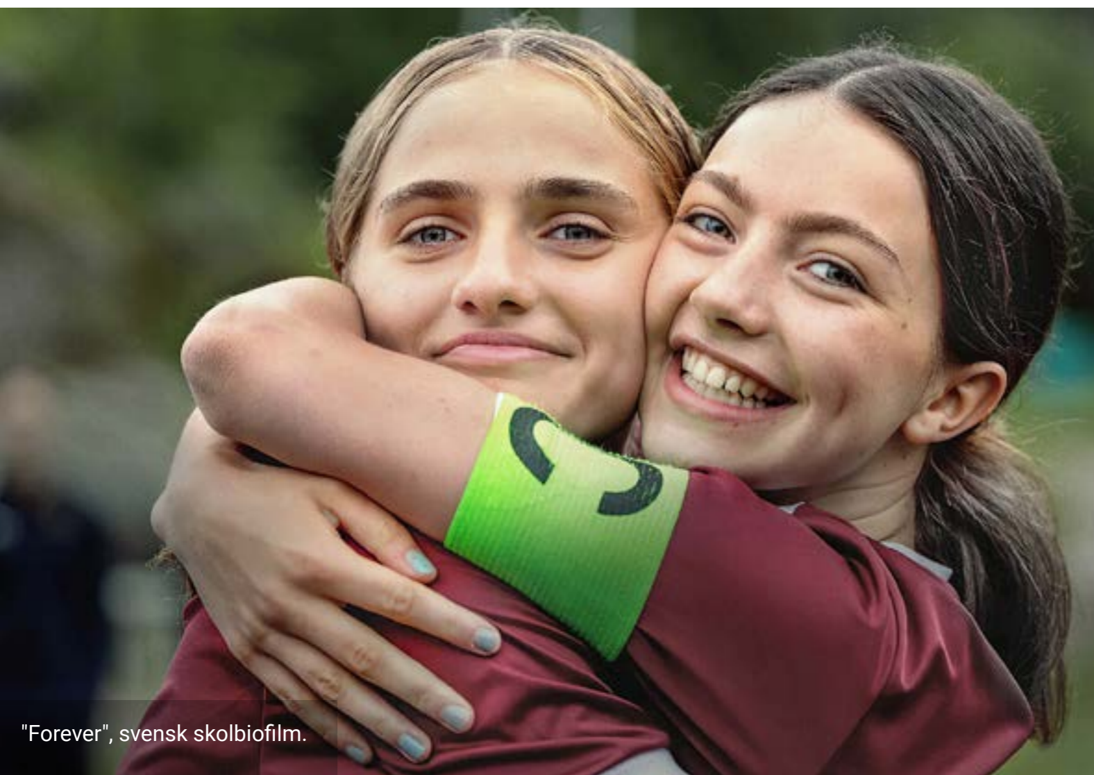
"Forever", svensk skolbiofilm.