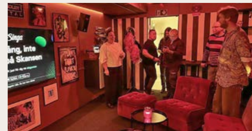
Nätverksträff i Älmhult med inspektion av karaoke-rummet.

Engagemanget i Nätverket Barnbiografmen och dialogen med kollegorna i våra närliggande regioner inom Regionsamverkan Sydsvenske fortsätter.