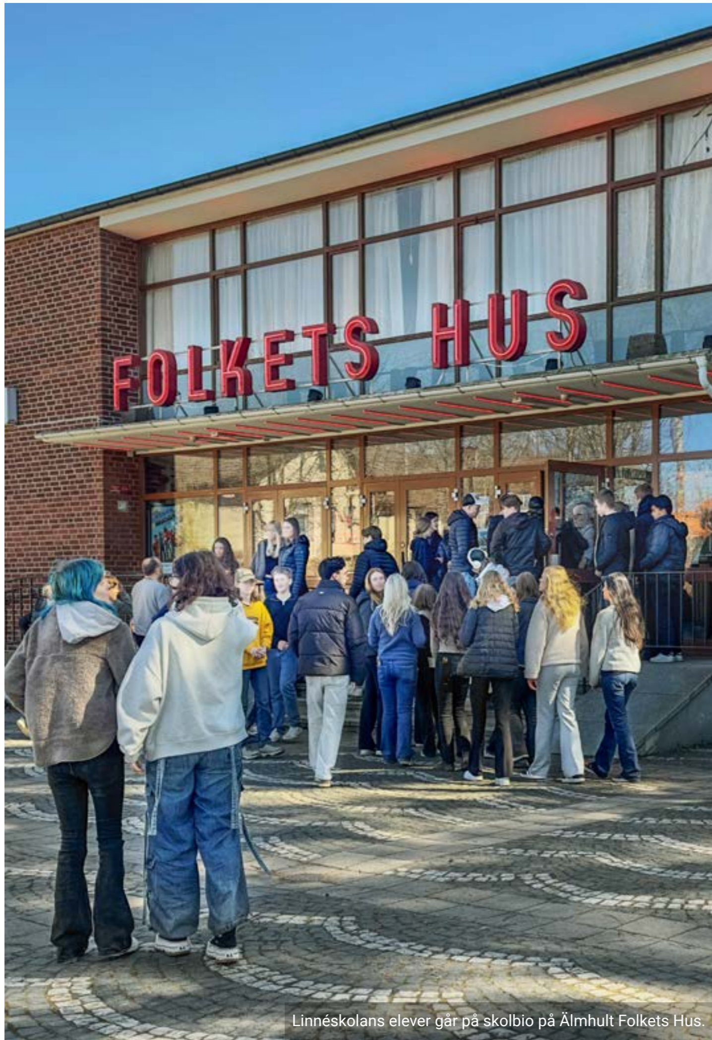
Linnéskolans elever går på skolbio på Älmhult Folkets Hus.