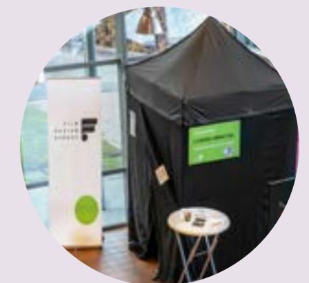
Vår Camera Obscura på mässtorget i Växjö.

Under Filmfest Sundsvall, som sker på hösten, hade FIBU sin andra träff. En av höjdpunkterna var att få följa med på en förskolevisning. I en fullsatt biosalong fick barn mellan 3 och 5 år uppleva kortfilmer från olika länder med en live-dubning av en mycket skicklig filmpedagog. Något att ta med hem till Sydost och framtiden!