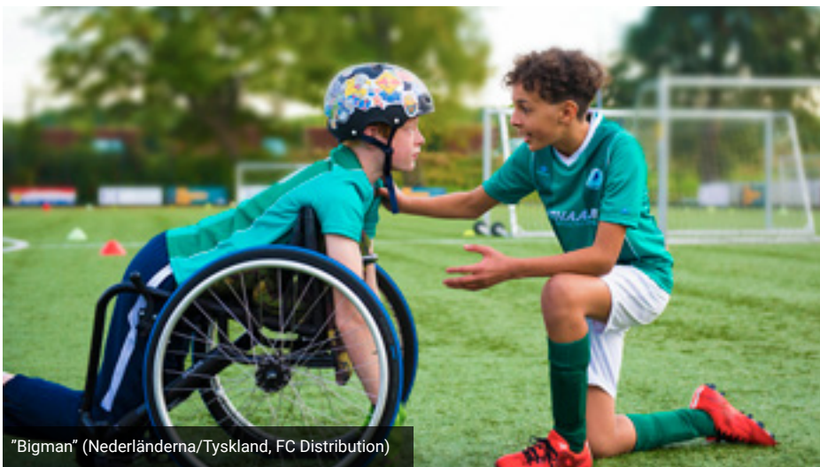
"Bigman" (Nederländerna/Tyskland, FC Distribution)

Blekinge, Kronoberg och Kalmar län är ett biograftätt område med runt 40 biografier. Många av dessa finns i ett Folkets Hus på en mindre ort.