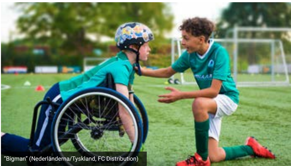
"Bigman" (Nederländerna/Tyskland, FC Distribution)

Blekinge, Kronoberg och Kalmar län är ett biograftätt område med runt 40 biografier. Många av dessa finns i ett Folkets Hus på en mindre ort.