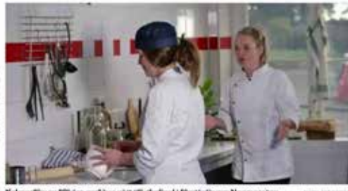
Kalmarfilmen "Skära ner" har gått till riksfinal i filmfestivalen Noomaratton.

Det är nu klart vilka filmer som har gått till riksfinal i filmfestivalen Noomaratton. En av dem kommer från Kalmar.