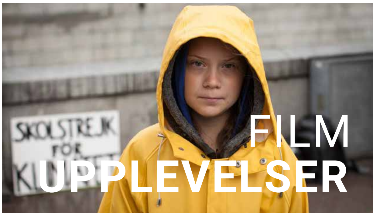
Bild ovan: "Greta" erbjöds som skolbio för klassrummet med tillhörande workshop. Filmregion Sydost stöttade visningarna med ett visningsstöd som nu är förlängt till år 2021.

Region Blekinge har sedan 2017 erbjudit samtliga kommuner i länet möjligheten att söka ett årligt ekonomiskt stöd för att starta upp, stärka och utveckla den kommunala skolbion.